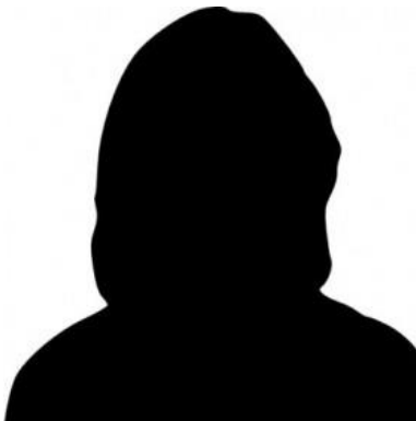
Delphine OGORECK Comptable